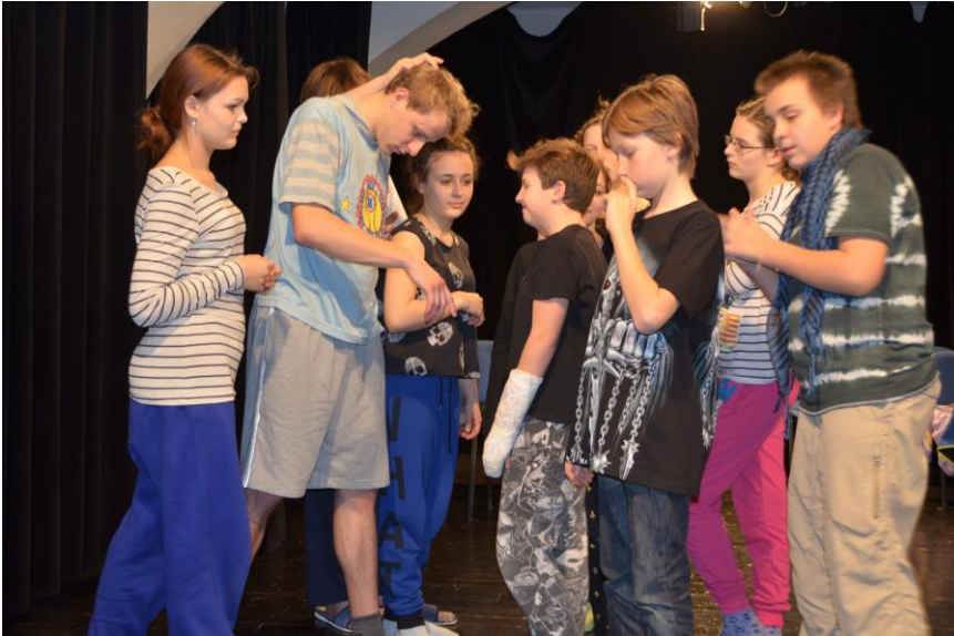
Pulci: Dávejte pozor!